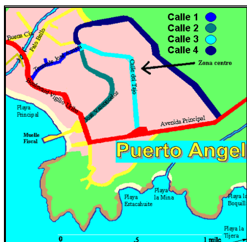
Figura 1.- Mapa de Puerto Ángel y Calles seleccionadas para el muestreo de viviendas.

principalmente, a que se trata de una localidad en la que predomina el estrato socioeconómico bajo.